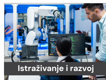
Istraživanje i razvoj