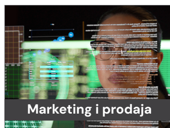
Marketing i prodaja